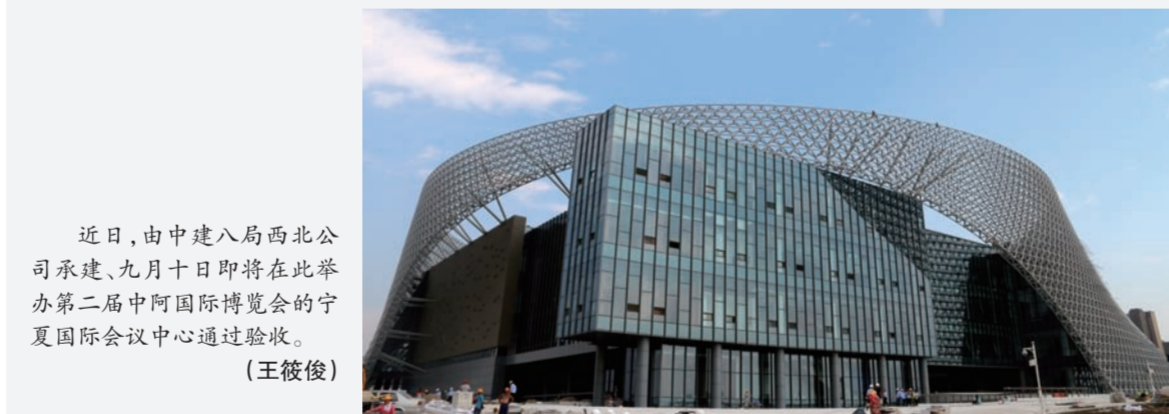
近日,由中建八局西北公司承建、九月十日即将在此举办第二届中阿国际博览会的宁夏国际会议中心通过验收。(王筱俊)