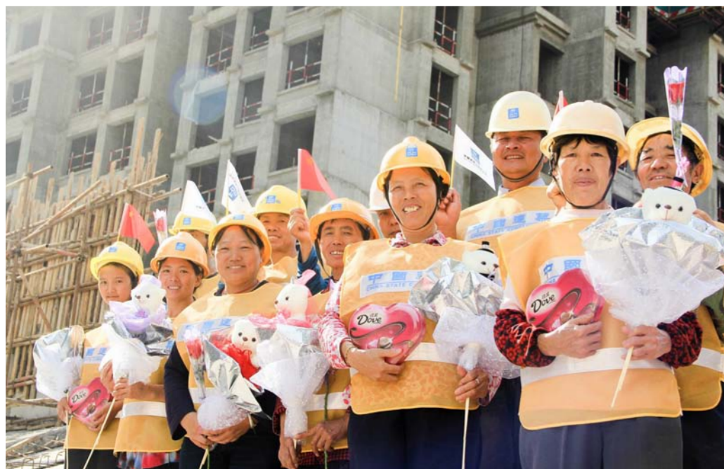
“七夕”当日,中建四局五公司云南分公司为昆明明园项目25对农民工夫妻送去了巧克力和鲜花,并记录下他们的幸福瞬间。(杨曼 杨梅)