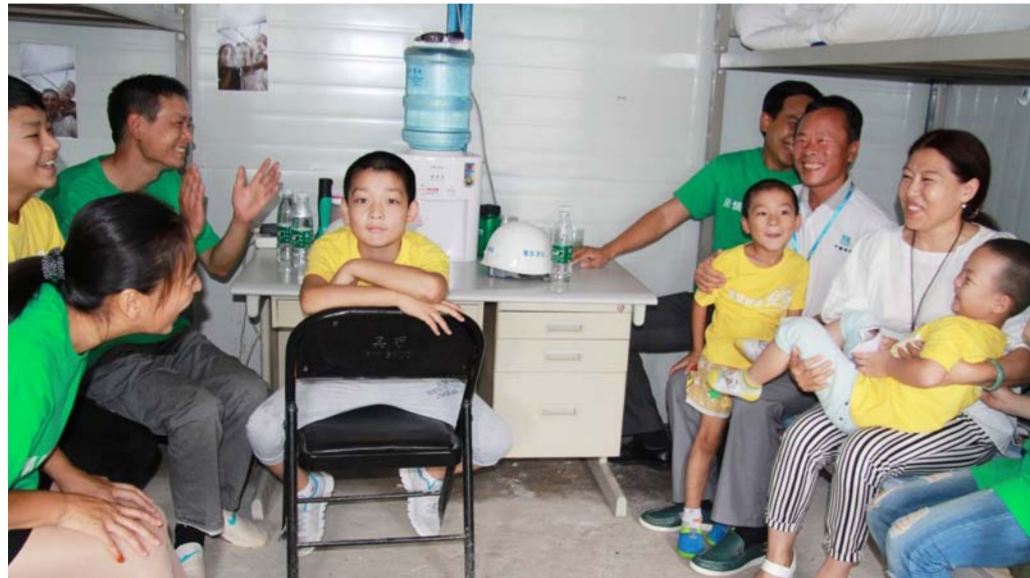
每逢暑假,中建二局一公司都会邀请农民工子女来到工地与父母团聚,这项活动已连续开展了六年。近日,该公司在中国人民抗日战争纪念馆启动了今年的活动。图为农民工家庭在“亲情小屋”快乐团聚。