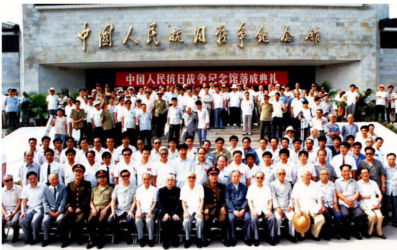
前国家领导人万里(第一排左起第九位)、王震(第一排左起第八位)、杨尚昆(第一排右起第八位)与中建一局建设者合影。

那个年代建工程,没有搅拌站,没有泵车,没有塔吊,只能把石、沙、水泥运到施工现场,在施工现场按照配比加工成工程需要的混凝土,再用人力小推车把混凝土一车一车推到浇筑地点。现场用的其他材料也大多是用小推车一车一车运的。