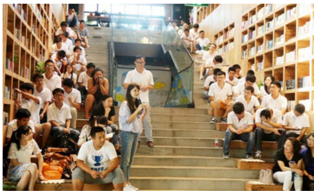
日前,中建西部建设子企业中建商砼在武昌区403国际艺术中心举办“奋斗的哲学”心理辅导互动式讲座。武汉片区的70余名青年员工与4位老师围绕“奋斗”和“幸福”话题展开聊天式讨论。(许 琛)