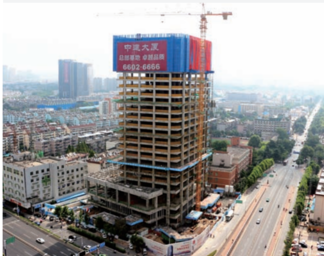
近日,中建四局合肥中建大厦项目主体结构封顶。该项目总建筑面积5.79万平方米,总高度111米,建成后将成为四局六公司办公所在地,同时也是合肥市瑶海区商业办公的新地标。(孟刘飞)