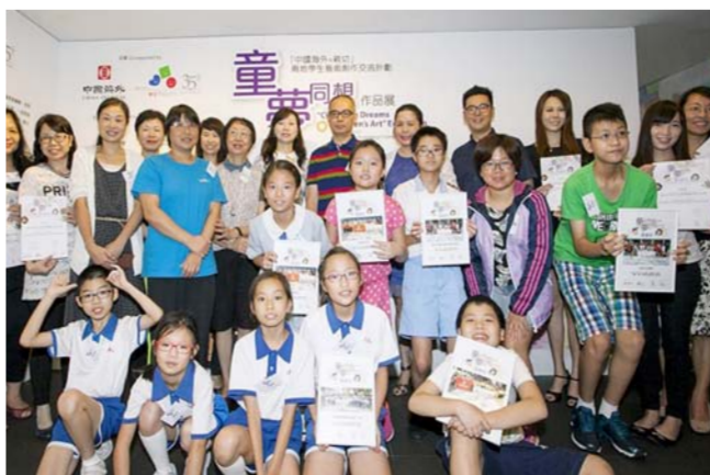
近日,由中国海外集团与儿童共融慈善机构合办的“童梦同想”——两地学生艺术交流计划结束,并于香港湾仔动漫基地举行作品展。活动汇集了来自香港、内地1400余名小朋友,完成了117幅大型拼贴作品。(钟 海)