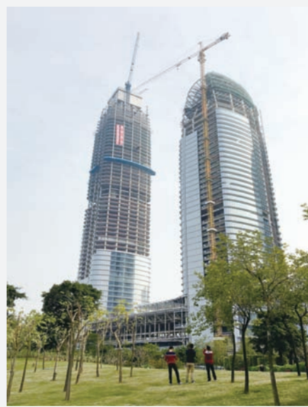
近日,中建三局一公司华南公司承建的琶洲第一高楼——311米高的广州保利天目塔主体结构封顶。(朱娅)