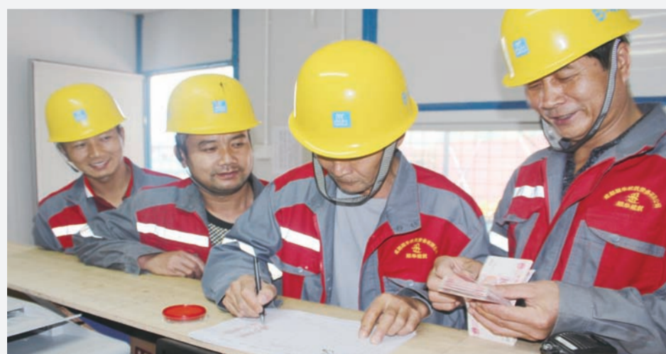
临近年关,近日,中建二局二公司深圳前海金湾项目对三家分包单位的劳务实名制工资发放情况进行摸底检查,以确保800多名农民工工资的按时发放。图为工人正在领取工资。(张燕梅 李华伟)