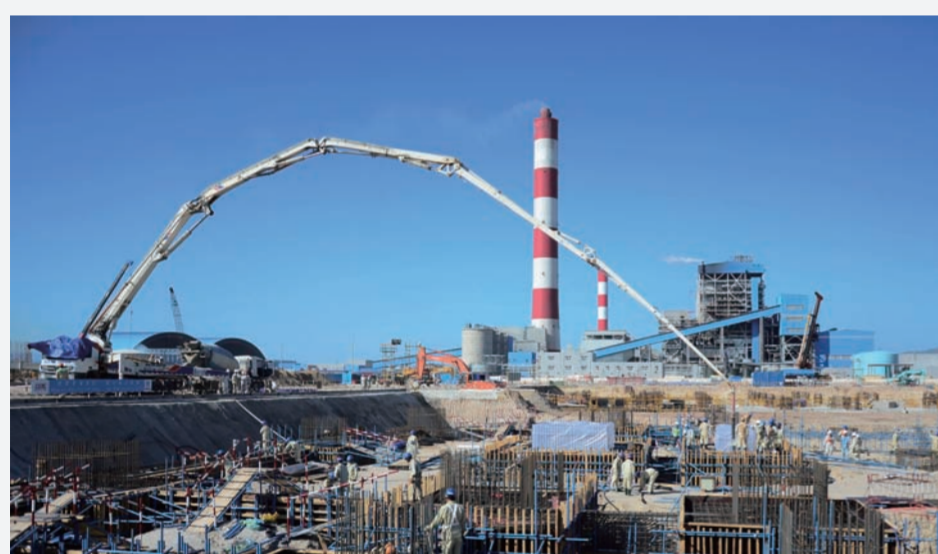
近日,中建电力越南新电厂项目克服当地风季和高温影响,提前20天完成2号锅炉基础的浇筑。该项目是目前中国企业在越南投资建设规模最大的电厂项目。(吴业钦 李蕾 陈诚)

推行绿色施工要算“总账”,就是真正把握绿色施工的本质,全面挖掘绿色施工的潜在效益。一方面,要将绿色施工作为一种系统的管理思想而不是单纯的技术手段来看待,跳出“四节一环保”的简单理解,将绿色施工与节约成本(最大限度减少施工对社会财富的损耗)、节约工期(最大限度减少施工对周围环境影响的时间)、节约劳动力(最大限度减少施工对施工主体的影响)结合起来,真正通过绿色施工实现环境、社会与经济效益的共赢;另一方面,要将绿色施工放到建筑全生命周期管理的高度来看待,积极协调解决建筑前期规划设计与后期运营维护的相关问题,带动设计方、业主方、供货方、分包方等形成合力,共同提高绿色施工水平与质量。