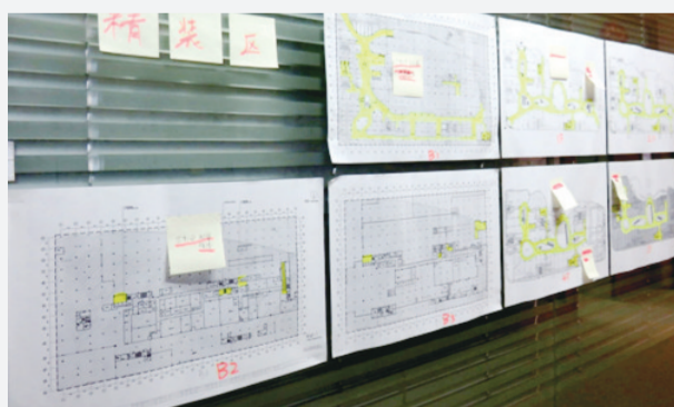
近日,中建三局二公司安装公司佛山中海环宇城项目打造了一面“作战沙盘”,在施工图纸上对已完工部位涂上绿色,对未完工部位涂上红色并贴小标签说明情况(一旦完工,纸条随时撕掉),直观展示项目各部分施工进度。该“作战沙盘”张贴在管理人员上下班必经的走廊中,员工可随时了解施工进度;项目经理则可据此对各专业施工情况及时进行整体调控。(邓秀琼 邓勇)