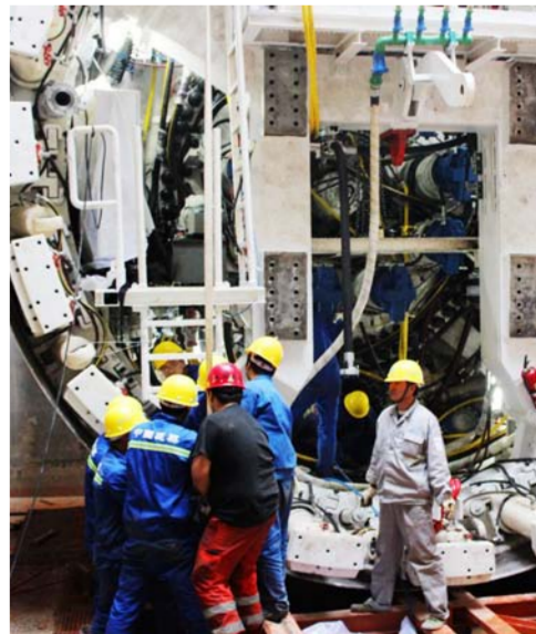
在深圳地铁项目盾构施工中,一个盾尾铰接拉杆需六人共同参与。

关,在优化隧道同步平行立体交叉施工的基础上,采用以巷道式通风为主,独头压入式与巷道通风对流循环相结合的通风系统。并提出洞内粉尘尾气洞内治理的新理念,先后自行研制水幕降尘、静电除尘器、通风加热器、台车辅助通风机等洞内粉尘尾气治理设备措施。(下转3版)