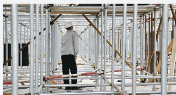
近日,中建二局三公司北京槐房万达广场项目全面推广应用插插式钢管脚手架,经测算,较碗扣型多功能脚手架每平米施工面积可降低成本约10元,该项目总计8.8万平方米的地下室可累计降低成本近100万元。该脚手架采用坚固的插头、插座铸钢焊接作为连接件,具有良好的强度、刚度和稳定性,节点连接无框度、能自锁,拆装简便快捷。(吕耀森 闻江)