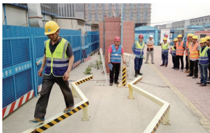
近日,中建土木轨道交通分公司北京地铁16号线13标项目部组织高处坠落、墙体倒塌、综合用电等体验式安全培训,100多名施工作业人员参加。(李洁)