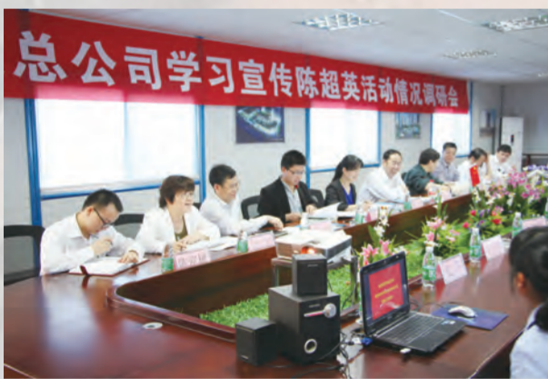
调研组在中建五局长沙项目部调研