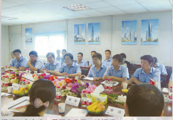
调研组在中建三局西北公司工地调研