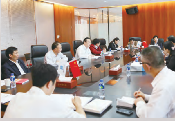
调研组在中建八局调研