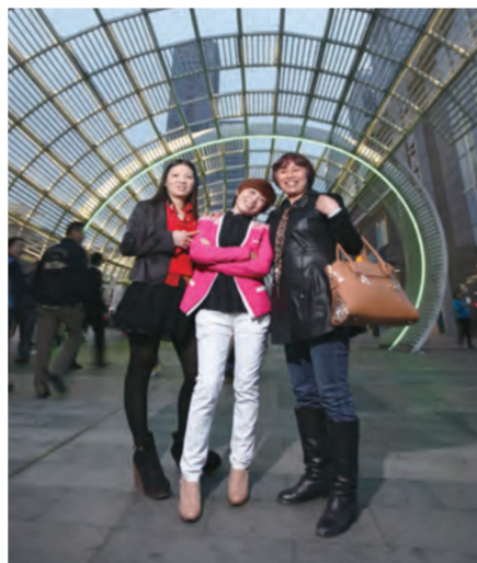
3月2日，中建三局南方公司深圳经理部邀请了专业摄影师，为农民工姐妹在深圳地标性建筑与热闹的商业街头留下了美丽的倩影。（冯士奇 王力）