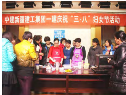
3月6日，中建新疆建工集团一建特聘专业烘焙师，为40余名女员工组织了一场现场学习西点制作活动。（巫春香 刘芳 刘王立）