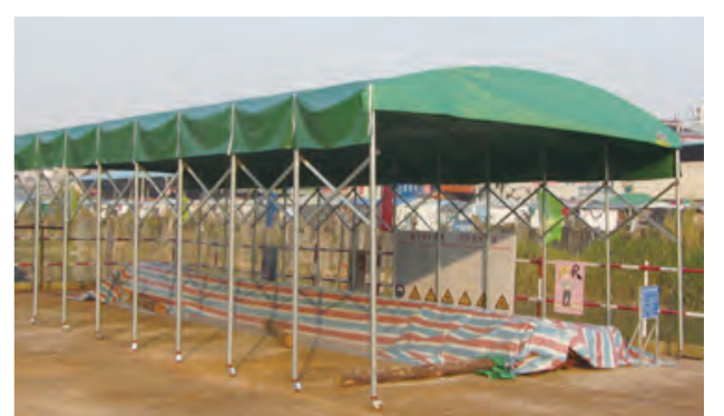
可移动、可伸缩简易钢筋加工棚示意图