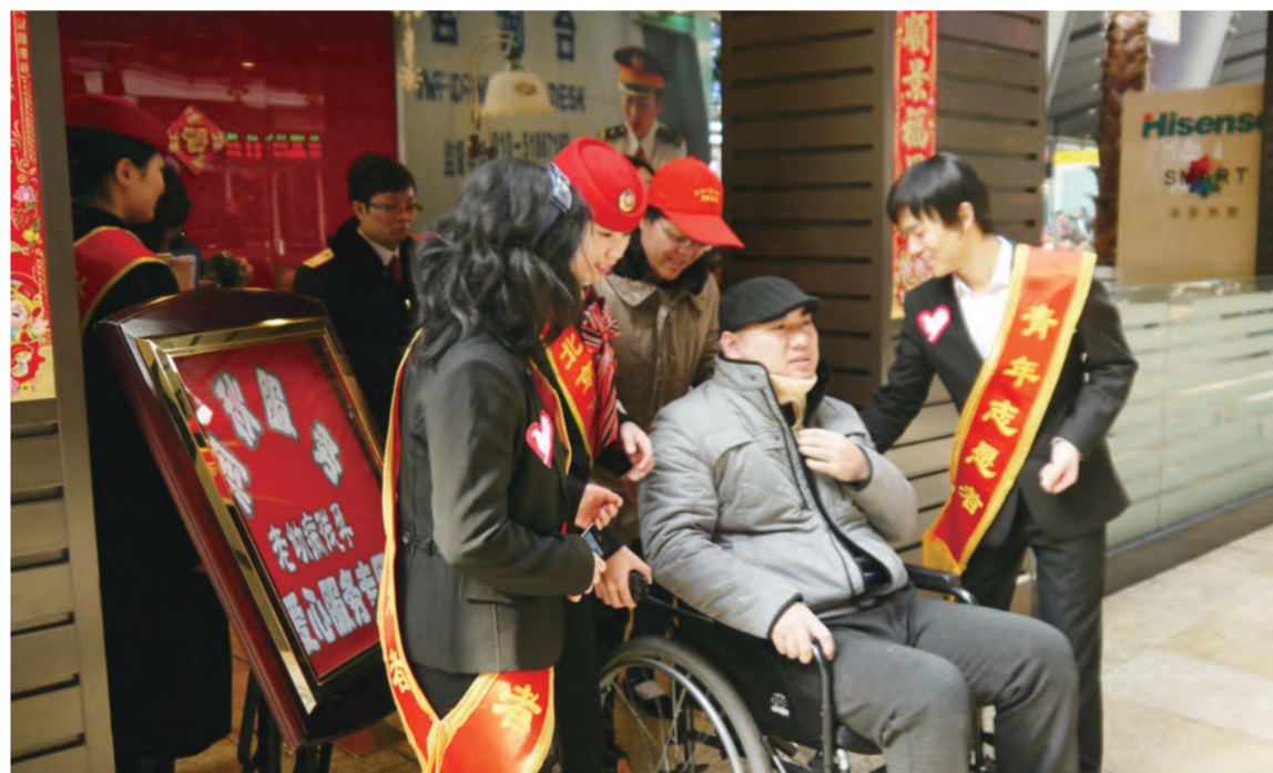
3月5日，中建六局铁路公司组织青年员工来到繁忙的北京南站，协助车站引导旅客，帮扶老弱病残。（向宇平）