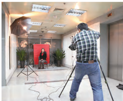
2月27日，中国建筑总部工会组织了专业摄影师为女员工拍艺术照。在繁忙的工作之余，总部女员工拥有了一个快乐美丽的下午。