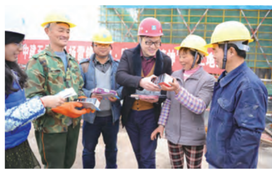
3月5日，中建五局土木公司江西华南城项目将各种文体用品和为工友拍摄的照片统一打包，邮寄给农民工远在家乡的子女。（张静）

3月5日，中建二局土木公司走进北京阿尔法社区，发放《车与祸》宣传册、《平安梦》剪纸画，义务向居民讲解安全出行常识。（饶昕昕）