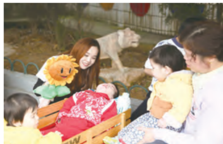
3月5日，中建三局三公司安分公司由80后妈妈组成的“爱心妈妈工作室”将价值六千余元的婴幼儿用品送到武汉市福利院。（李健 葛荟）