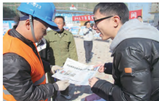
3月5日，中建二局一公司特邀《工人日报》记者现场讲解“农民工周刊”，并开展了义务理发及体检等活动。（龙巧灵 张彬）