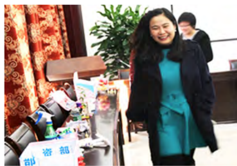
近日，中建三局总承包公司天津分公司女职工利用废旧物品，通过一双巧手做成30余件美观、实用、富有创意的环保艺术品。（杨海芳）