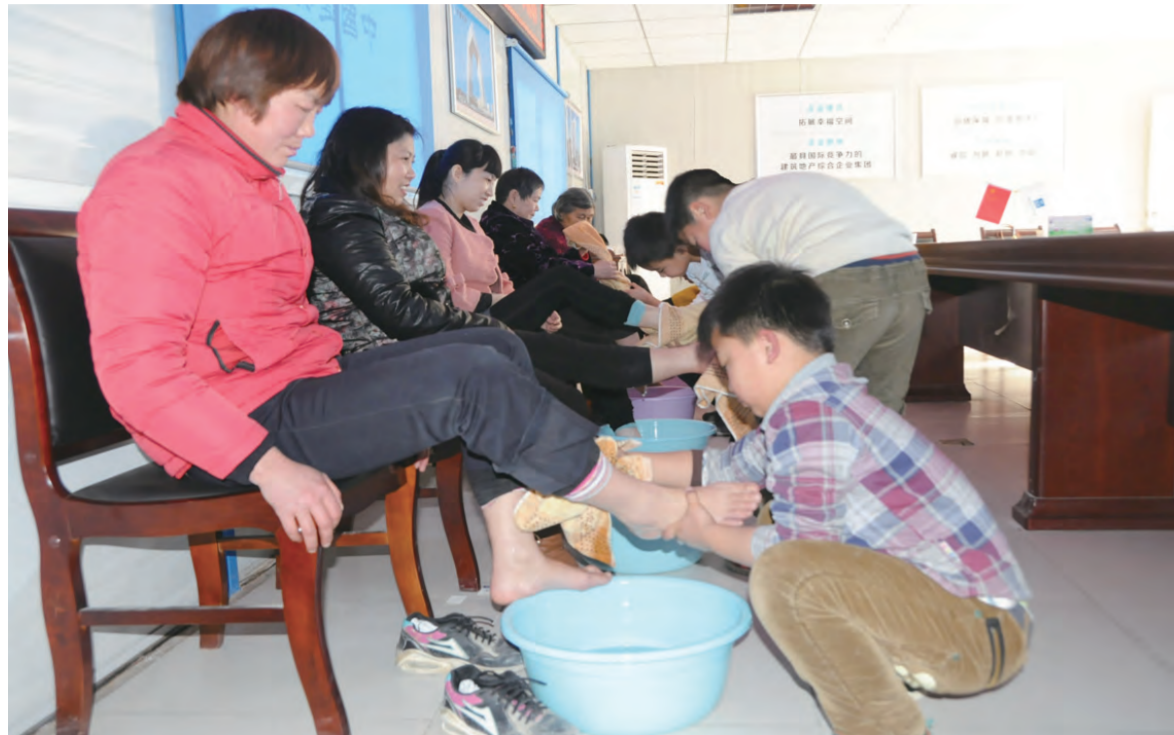
近日，中建七局总承包公司郑州中大型项目邀请四川、贵州、重庆等地女农民工子女来到工地，与母亲团聚。孩子们用稚嫩的小手认真地给母亲洗脚、擦脚，场面温馨感人。（李嘉佳 卫素娟 张旭林）