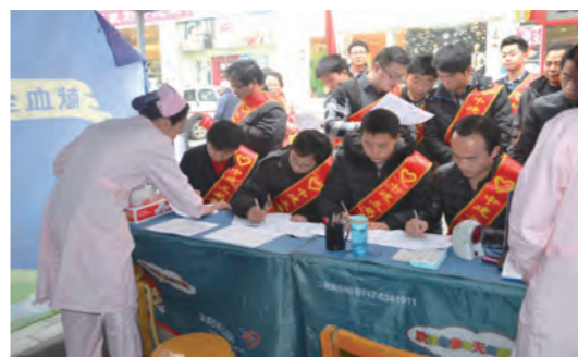
学雷锋日到来之际，中建三局一公司基础设施分公司宜昌点军大道项目经理部20余名员工踊跃报名无偿献血。（杨荣平 陈波）