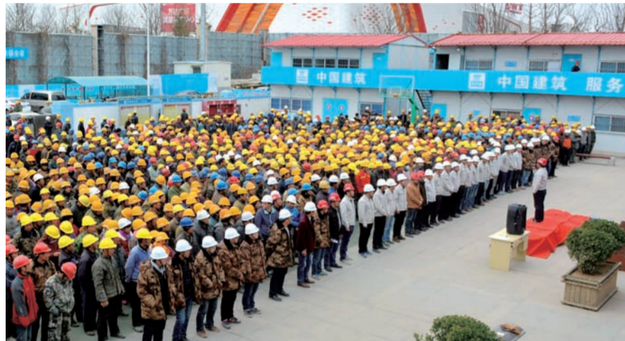
近日,中建二局二公司青岛万达游艇产业园项目组织全体劳务队开展“质量安全集中活动日”活动,千余名劳务人员在活动条幅上签下自己的名字,谨记施工安全和质量责任。(李华伟 孟军辉)