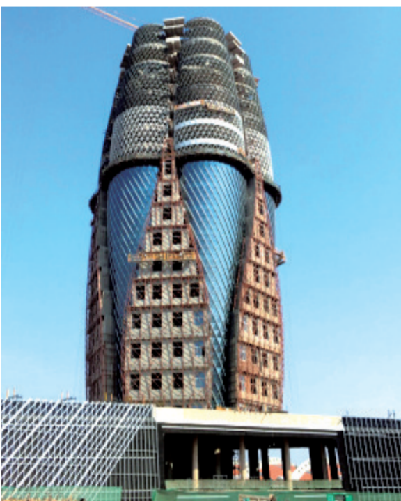
近日,中建装饰华鼎装饰创新工艺,突破技术难关,完成以六只巨大高足杯齐聚葡萄酒桶为造型的烟台张裕葡萄酒科研大厦外幕墙及铝板幕墙基层龙骨安装,一栋巨型工艺品建筑矗立于烟台百年张裕工业园。(刘浩然)