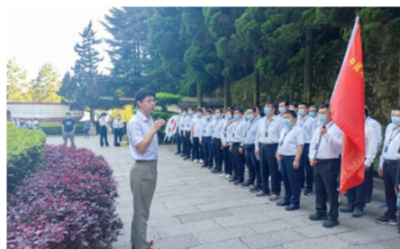
中建港航局开办“学习百年党史 汲取奋进力量”党史学习教育专题培训班。

坚定不移践初心,全力拓展员工幸福空间。各级党组织牢记初心使命,坚定发展信念,带头攻坚克难,奋力实现企业高质量发展目标,为满足广大职工的美好生活向往提供最可靠、最充实保证。更加自觉践行党的宗旨和群众路线,及时呼应、有效解决职工群众急难愁盼问题,持续增强员工获得感、幸福感,积聚推动中建港航事业发展的群体智慧、团队合力。