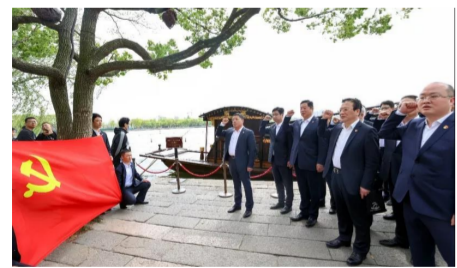
中建八局领导班子成员赴嘉兴南湖,重走一大路线,重温入党誓词,感悟红船精神。

深入贯彻新发展理念,推动更高质量发展。立足新发展阶段,中建八局将围绕中建集团“一创五强”战略目标和“166”战略举措,聚焦“六个一流”,推进“六个专项行动”,深化国企改革、强化科技创新、提升价值创造,坚持锻长板、补短板、育新板,全力打造“万亿八局”,努力实现更具价值、更有效率、更加协调、更可持续、更为安全的发展,为全面建设社会主义现代化国家贡献力量。