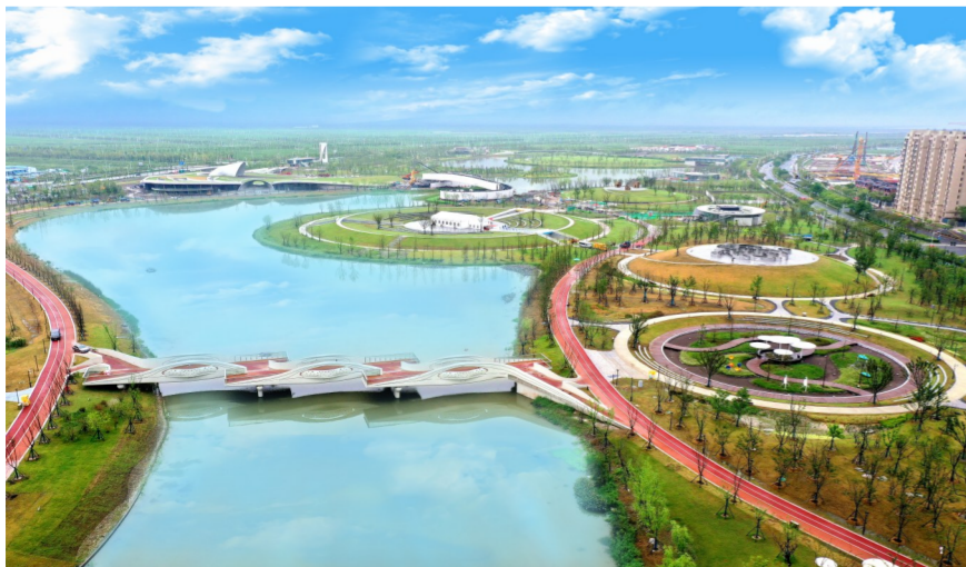
8月16日，中建八局承建的上海南汇新城星空之境海绵公园DBO项目开园试运行，这是全国第二批海绵城市试点的重点示范项目，也是上海市最大的海绵公园项目。项目总用地面积54万平方米，其中绿地面积41.3万平方米，是集观星活动、湿地公园、海洋科普、水景互动、探秘竞赛、观光游乐为一体的特色公园，致力于打造临港核心区乃至上海城市建设发展的一张新名片。(杨婕)

近日，中建安装华北公司承建11站11区间及停车场的供电、通信、信号系统的重庆轨道交通9号线一期工程实现1500V通电。(张雨)