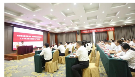
中建产研院党委书记为全体党员讲授贯彻新发展理念专题党课。

要持续聚焦高质量发展,打造原创性产业技术策源地。坚决打赢关键核心技术攻坚战,要建成、用好“万吨级多功能试验系统”,打造国家级重点实验室,抓好创新发展这一关键题,做好重大课题项目、核心技术攻关研发,建成国家级科技创新平台。