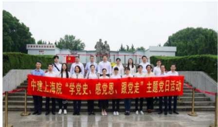
中建上海院赴沙家浜红色教育基地开展“学党史、感党恩、跟党走”主题党日活

弘扬伟大建党精神,增强斗争本领。“十四五”时期,中建上海院将更加完整、准确、全面贯彻新发展理念,以科技创新为引擎,巩固夯实既有优势,大力拓展新兴领域,积极争做全面建设社会主义现代化国家建设新征程上的排头兵、先行者,以企业的高质量发展为集团实现“一创五强”战略目标贡献更大力量。