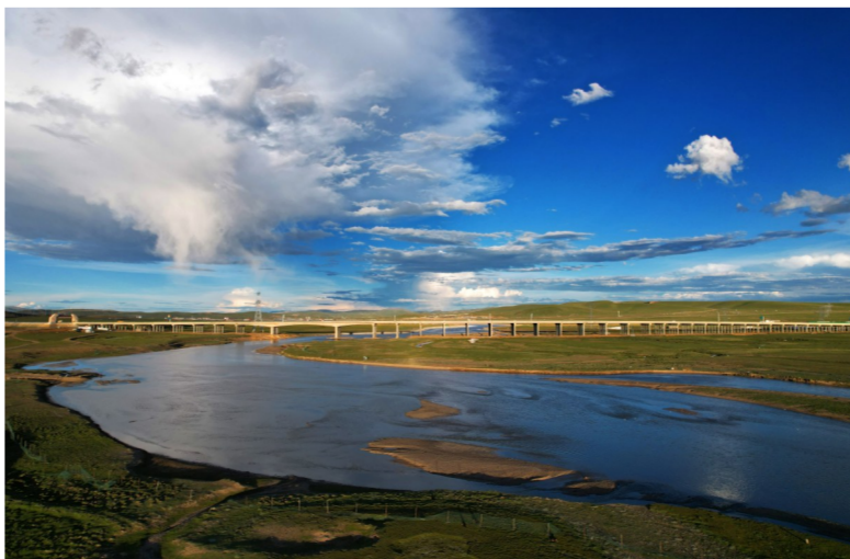
8月21日，中建交通承建的G6京藏高速那曲至羊八井段一标项目正式通车。一标段项目全长65公里，采用双向四车道高速公路标准建设，设计时速120公里，全程平均海拔超过4500米，是当前世界海拔最高的高速公路。G6京藏高速那曲至拉萨段的贯通结束了藏北不通高速的历史，也使拉萨到那曲间的车程由原来青藏公路的6个小时缩短至3个小时。(褚占坤)