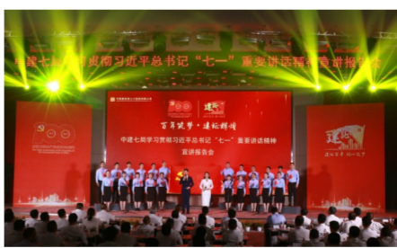
中建七局召开学习贯彻习近平总书记“七一”重要讲话精神宣讲报告会。

三是要主动担当作为,凝聚发展共识,聚合合力、开新局。作为企业主要负责人,我要带头将习近平总书记重要讲话精神落实到行动上,坚决扛起责任、管好班子、带好队伍,带领全局上下齐心协力、同舟共济,坚守在平凡的岗位上,作出不平凡的贡献,全力开创企业高质量发展新局面,不负伟大时代,不负党的重托,不负职工群众期待,为集团实现“一创五强”战略目标贡献力量!