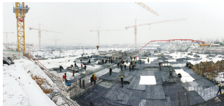
近日,长春迎来入冬后首场降雪,气温低至零下18摄氏度。中建六局长春际华园项目采取多种措施保证混凝土入模温度,顶风冒雪坚持完成工程底板混凝土连续浇筑,为按时履约奠定基础。 (赵阳 刘萍)