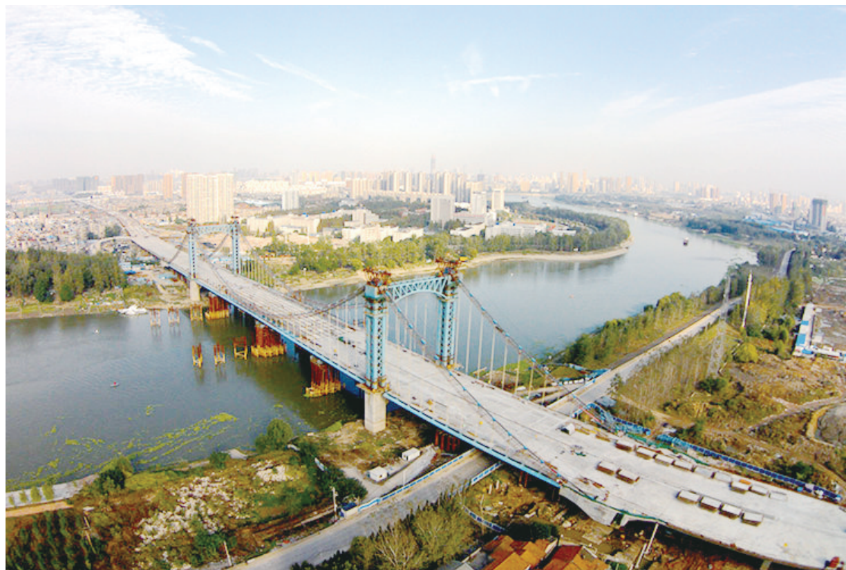
近日,中建三局总承包公司承建的全长3050米、汉江上最宽、武汉市首座自锚式悬索桥——武汉江汉六桥主桥主体结构全线贯通。大桥因桥塔拥有淡普鲁士蓝色、凯旋门式造型而被誉为“汉江上最美桥梁”。 (易娟)

本报讯 (通讯员王 烁)经过一段运行,近期中建五局三公司安装分公司推行智能办公理念所自主研发的信息智能周报系统,稳定有效,可代替过去一个员工耗时四天的工作。该智能办公系统界面简洁,功能实用,中高层员工通过手机、iPad和电脑等设备使用普通网络浏览器,输入自己的协同号即可登录操作,即使出差在外也可随时随地发布个人工作报告,分公司分布各地的66份个人周报不再需要任何人收集、整理等,系统可自动生成当期周报,大幅提升了办公效率。