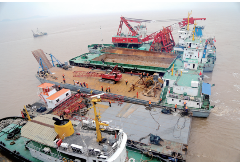
近日,随着“中远祥瑞口”4万吨级半潜船主甲板在舟山朱家尖海坪缓缓浮出海面,11条工程船完美坐墩,中建港务吉布提项目工程船舶装载调遣工作顺利完(兴 港)