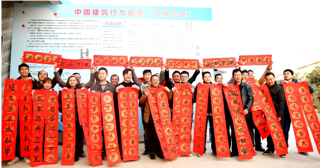
书画家为我写春联

计时工即项目“杂工”，主要指项目文明施工、迎检接待等方面的临时用工，具有非固定性、难计量的特点，开支大又难控制，一直是项目成本管控的难点。为使计时工的使用更规范合理，该项目部采取了“网络平台申报制”进行管理，即项目管理人员统一利用QQ、微信群，提前提交用工计划，注明用工使用部位、队伍及时间等要素，部分代工要明确责任队伍，所有用工信息实现动态化、透明化，月底结算以平台申报信息作为核算依据，改变了过去计时工用工计划不清、效率不高的方式，有效避免了窝工、串工及混工等现象的发生。