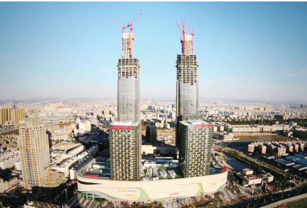
近日,由中建二局西南分公司承建、中建西部建设承担C60高强混凝土泵送、高307米的昆明西山万达广场“双子塔”主体工程提前封顶,混凝土各项参数全部优良。(许汉平 郝帅涛 严政)