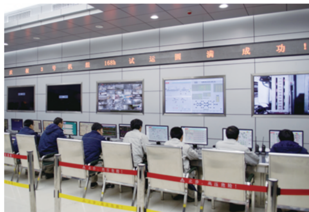
近日,中建电力中环工程公司唐山开滦项目3号机组与脱硫系统同步完成168小时试运行,各项技术指标优良,得到业主和监理方的充分肯定。(黄文 罗峰)