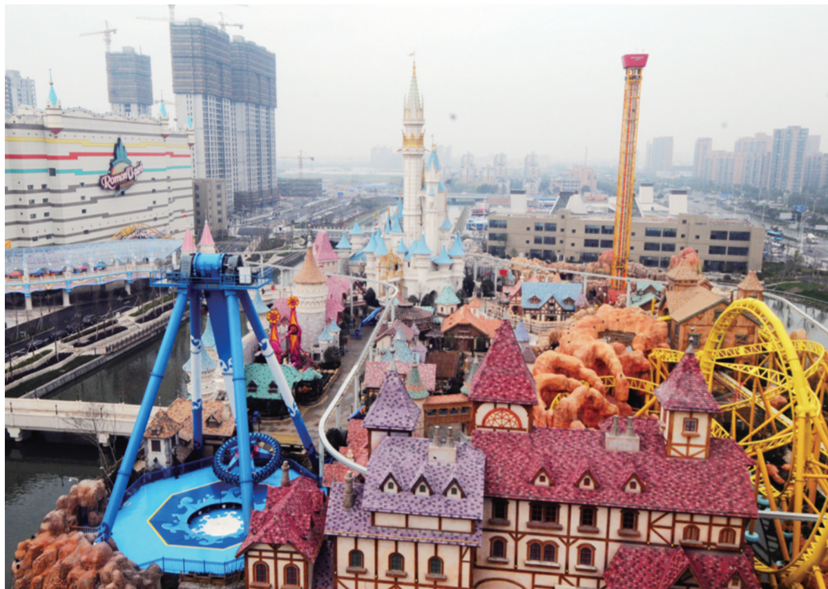
3月17日上午,由中建二局上海分公司承建、总投资50亿元的宁波罗蒙环球乐园正式进入两个月的试运行阶段。该乐园建筑面积达20万平方米,共规划有罗曼蒂克大道、梦幻世界、神秘大陆、冒险之旅、欢乐广场、传奇岛六大主题区。(吴业钦 童延江)