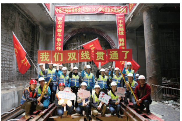
近日,中建三局一公司承建的深圳地铁9号线9104-1标段提前18天实现双线贯通。(程超 王坦)