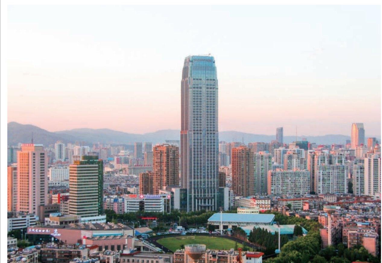
近日,中建三局南方公司承建的主楼建筑高度219.3米的昆明昆钢科技大厦竣工。该大厦总建筑面积148708平方米,集高档办公楼和现代星级酒店为一体,是云南已竣工第一高楼。(李建琴 牛利强)

近日,由中建二局西南分公司承建的湖南省在建第一高楼——长沙国金中心项目452米高的塔楼已施工至地上43层,高度突破200米。(陈柯宇 穆龙飞)