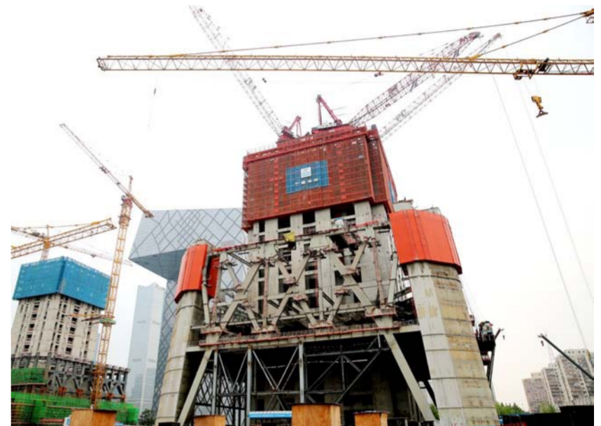
近日安装完成的中国尊大厦首道转换桁架

项目部在施工中认真研究验算,做好桁架安装过程模拟,明确施工重点、难点,对桁架进行合理分段,采取地面散件组拼,高空整体拼装方案,成功解决桁架整体截面大、重量重、跨度广的问题。项目部做好技术、质量交底,挑选优秀焊工,做好防风防雨和防暑降温,夜以继日连续施工。针对桁架焊接大多为60毫米厚板,横焊、平