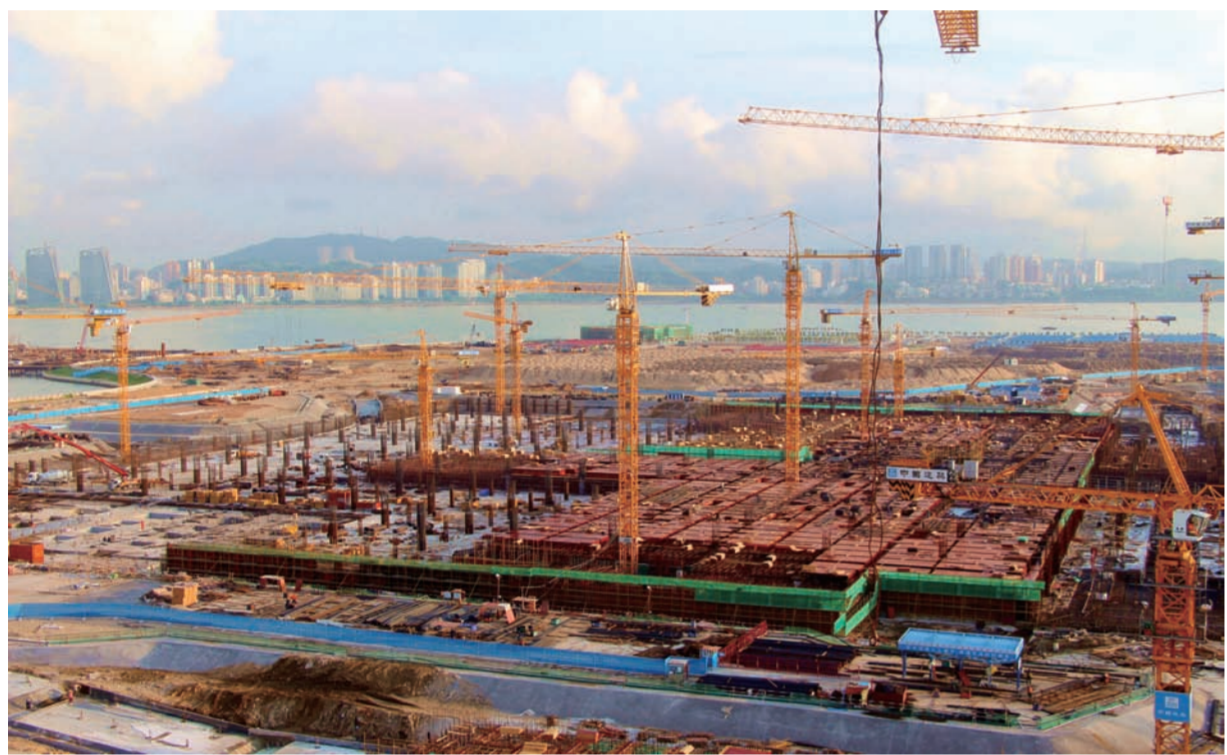
近日,中建三局一公司承建的港珠澳大桥珠海口岸(1标段)项目,浇筑量达7.5万立方米的底板混凝土浇筑完成。浇筑过程中,该项目创新运用了物联网无线智能混凝土温度监控系统。(赵伟)

新落成的中建大厦位于南京市栖霞区仙林大学城,建筑面积79000平方米。公司总部及部分分公司办公区位于7-10层和4层。大楼设有500平方米的职工餐厅和200平方米的职工书屋,而280平方米的文化展厅将成为迎接业主考察、文化培训的重要平台。新楼具备国内先进的照明系统、门禁系统、远程监控系统、无线会议系统,实现了全无线网络覆盖、无纸化办公和节能降耗,为员工提供了优质、高效的综合办公环境。