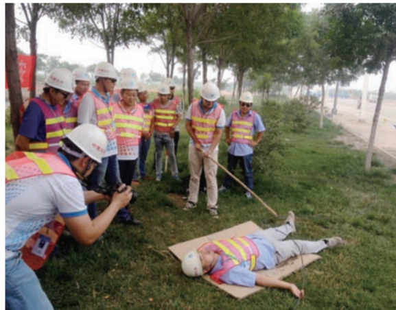
为提升新员工的安全意识和应对突发事件的能力,近日,中建二局土木公司唐鲁项目部组织10名新员工参加触电应急演练。(孙英超 高俊亮)