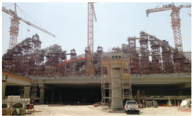
近日,中建中东和中建钢构阿布扎比国际机场项目部自主设计的1.5万吨胎架、工装等临时措施全部设计完成并投放加工。该项目屋面钢结构组件跨度大、节点复杂,临时支撑胎架需求量大。(杨圣邦 李磊 刘路)