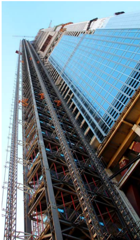
单独建设于大厦一侧的“钢塔”——117大厦通道塔

本报讯 (记者程超 通讯员王腾)近日,中建三局承建的天津117大厦通道塔施工至101层顺利封顶,500.61米的总高度使其成为全球最高的通道塔。