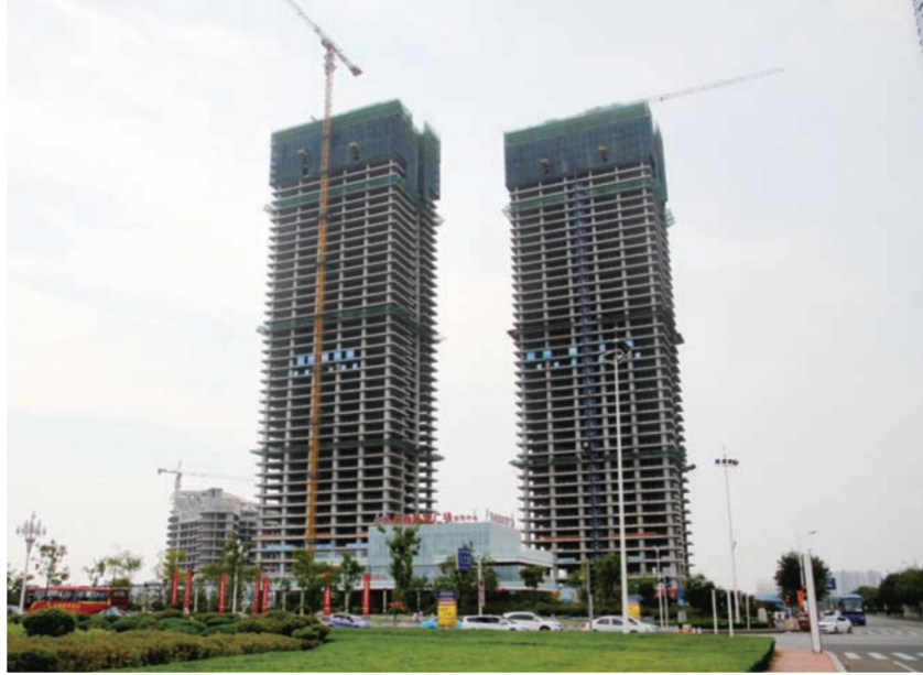
近日,中建八局四公司承建的日照市第一高楼——日照兴业喜来登广场项目双子塔楼主体结构封顶。(付兴杰 刘越)