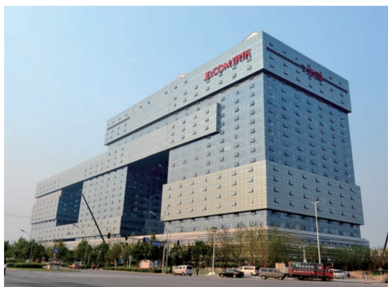
近日,中建六局中建城建公司承建的总建筑面积28万平方米、位于北京亦庄的京东商城总部基地项目运营移交。(姚东东)

“收到短信没?工资到账了!”近日,在试行农民工实名制的中建四局五公司贵州分公司城市万科·玲珑湾项目,12家班组的267农民工们陆续收到了银行短信提示和共计132万元工资。(经华 刘杨 胡婉婷)