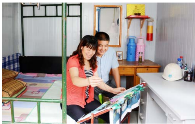
农民工夫妇成为“有房一族”

近日,中建三局二公司北京公司航天六院科研楼项目为农民工夫妇设置了“夫妻房”,并提供直饮水机、无线WIFI等便利条件。农民工夫妻凭借身份证、结婚证等证件即可申请免费入住,目前项目已有6对农民工夫妻住上了“有房一族”的都市生活。(秀琼 马群芳)