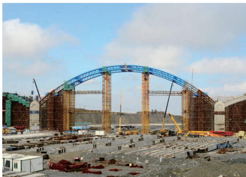
近日,中建西部建设乌鲁木齐分公司成功将758立方C50自密实微膨胀混凝土压入新疆首座飞燕式钢管混凝土拱桥——水板大桥超大大钢管拱,为大桥顺利完工奠定基础。水板大桥位于乌鲁木齐,主桥全长230米,钢管拱直径0.85米,跨径150米。(陈璐 许海鸿)