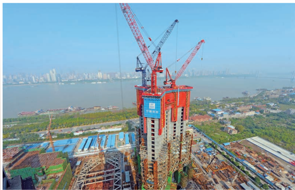
矗立长江畔,设计高度636米、华中第一高楼、世界第三高楼——武汉绿地中心