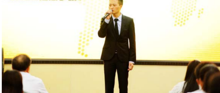
“职来职往”竞聘大赛

作为党群行政系统的员工,活动策划是一项必修课程。10月即将举行的集体婚礼为例,谈谈策划一场大型活动流程和注意事项。