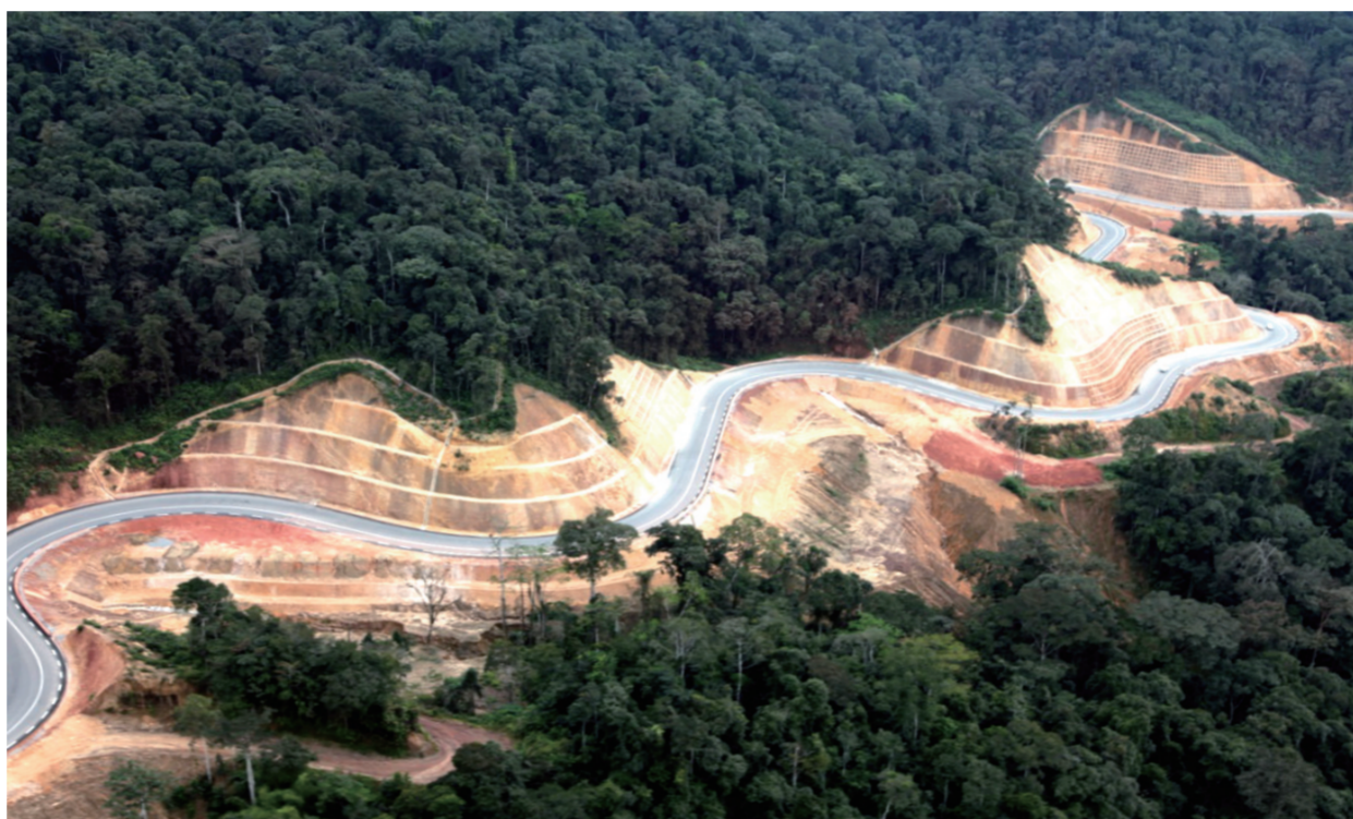
穿越草原、沼泽地和马永贝原始森林的刚果(布)国家一号公路,蜿蜒536公里,将该国首都布拉柴维尔和经济中心城市黑角连接起来,构建出一条新的经济走廊。

水用电和住房困难等艰苦生活条件毫不气馁,工作之余,积极开展篮球比赛等文化体育活动,并以乐观的精神在工地自建生态菜园、养猪喂鸡,千方百计提高员工生活质量。