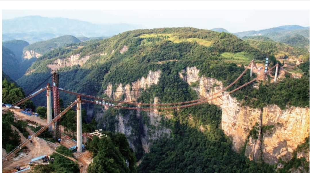
近日,中建六局承建的张家界大峡谷玻璃桥主缆横向对拉施工完成,整个主缆和吊索由平面转换为空间索面结构,最大横向矢跨比约达0.05,为目前世界第一。(赵蘅生屈喜庆)