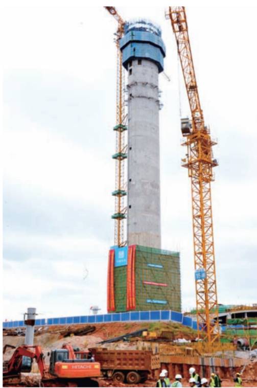
近日,由中建三局承建、中建西部建设中建商砼主供混凝土的武汉天河机场T3航站楼空管工程塔台主体结构封顶,并以其115米的高度成为国内第一、亚洲第二高塔台。(田野 潘慧)