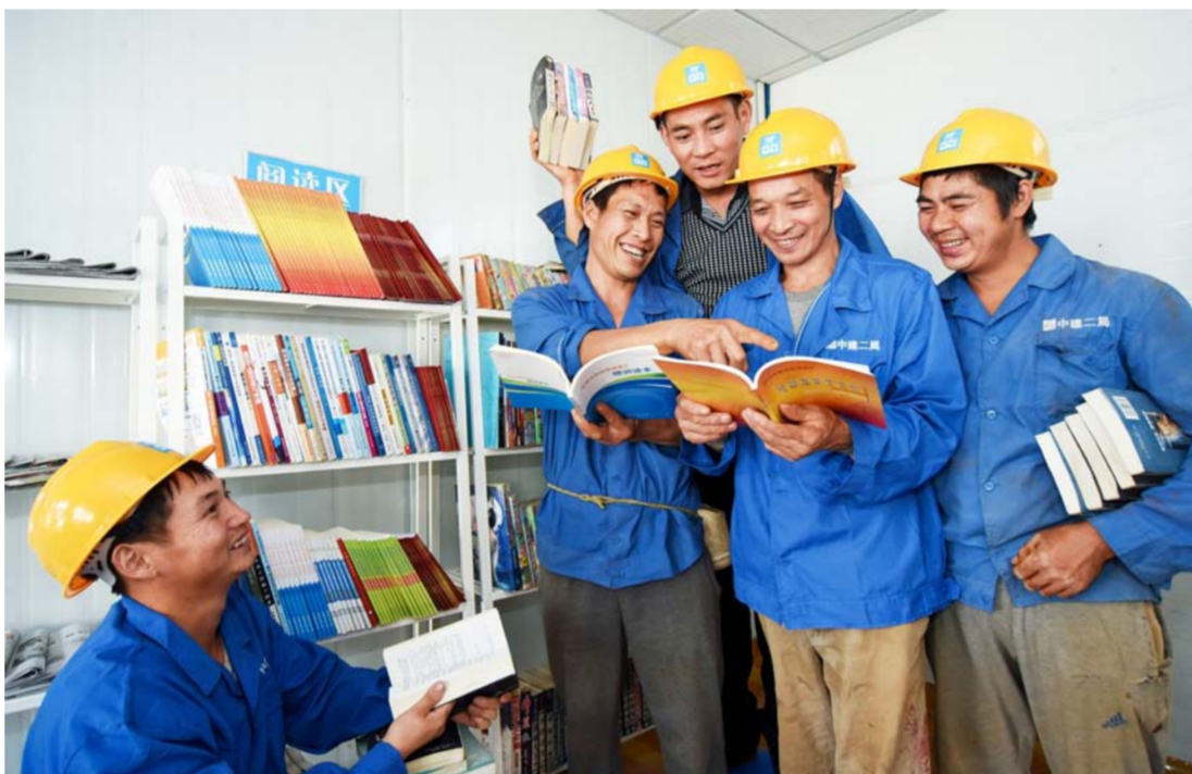
农民工假期“充电”忙

日前,中建六局装饰公司到屋内多处漏雨的天津滨海新区祥羽孤独症康复中心进行免费修缮。(杜春辉)