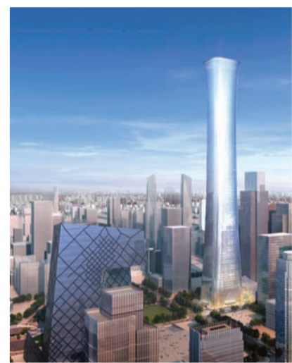
北京第一高楼——中国尊