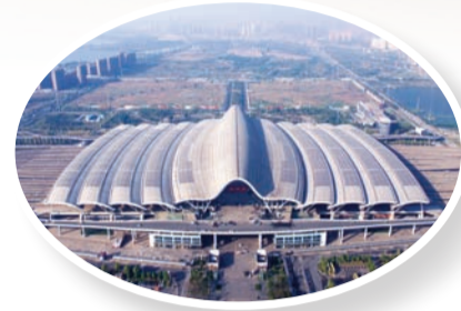
全球最美建筑——铁路站房武汉站

面对未来,中建三局董事长、党委书记陈华元充满无限憧憬:“中建三局将在中国建筑战略的引领下,坚持以‘七个并重’为统领,以建造、投资‘两轮’驱动为主线,以改革创新为动力,转型升级,提质增效,致力成为卓越的建造企业、优秀的投资企业、真正的跨国企业、成熟的现代企业和一流的文化企业。”