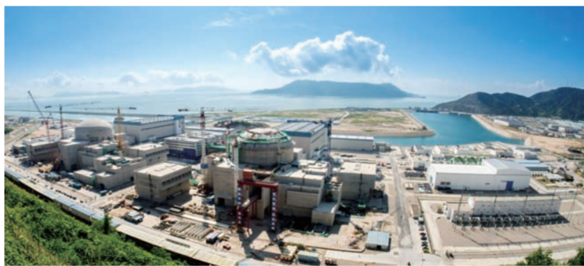
采用第三代压水堆EPR核电技术的广东台山核电厂雏形初具。

中建电力全面掌握采用第三代压水堆EPR技术的核岛关键施工技术并积累丰富施工经验,这将有力提升中建电力乃至中国建筑在国内核电市场的竞争力,并为进军海外核电市场做好准备。