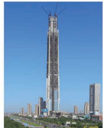
中国结构第一高楼——天津117大厦

北希望工程——中建三局“争先筑梦·青年成长”基金在武汉启动,资助户籍在湖北省内四大连片贫困地区、革命老区、国家级贫困县的贫困一本大学新生,以及考上二本以上高校的中建三局贫困务工人员子女。目前,首批200名大学贫困新生每人一次性获得5000元资助顺利入学,让家庭贫困的青少年实现了人生梦想。