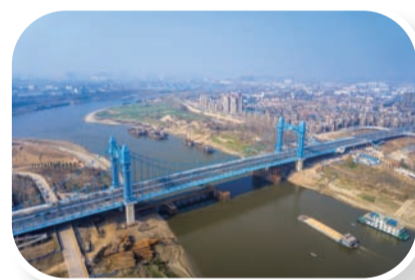
武汉首座双塔自锚式悬索桥——古田桥