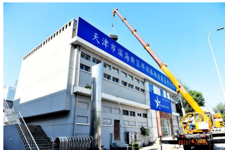
免费修缮孤独症儿童康复中心

近日,中建西部建设子企业中建商砼举行第二届“职来职往”竞聘大赛。10名竞聘者参与了四个职位——生产管理、技术管理、营销管理和党群行政管理方向厂站助理的竞聘。通过面试的竞聘者当场收到推荐信,获得三个月的试用机会,如试用合格,则将正式任命。(韩 偶)