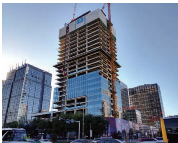
近日,由中建一局承建、位于北京建国门外长安街畔、高120米的北京凯特大厦封顶,将成为投资了《让子弹飞》等经典电影的英皇集团中国总部办公楼。(易宣)