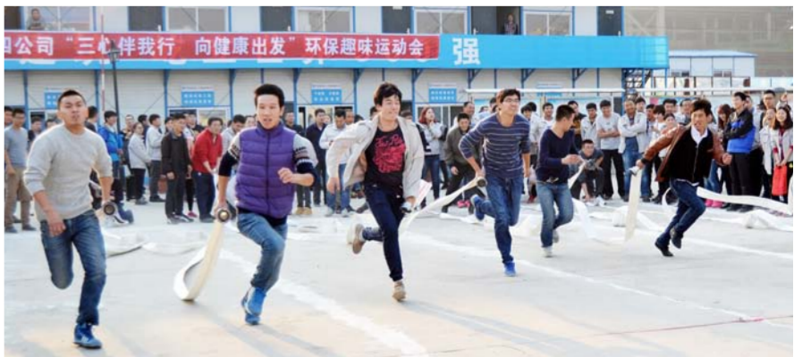
哈尔滨万达茂就地取材办运动会

近日,中建八局大连公司职工艺术团来到哈尔滨滨泰城项目,艺术团精心编排的歌曲、小品、相声等节目赢得了农民工的阵阵喝彩。演出过程中还穿插了农民工安全、法律知识有奖问答。