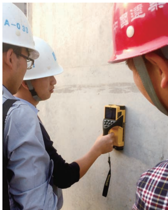
在近期举办的质量月活动期间,中建五局土木公司江西分公司组织行动小组赴各项目对盖板涵砼强度等进行实测实量,用数据说话,严控质量。(王延军)