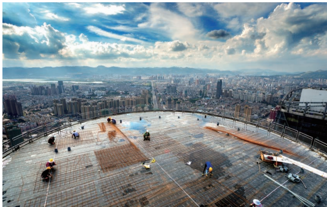
近日,由中建二局西南分公司承建的云南第一高楼——双子塔高度为307米的昆明西山万达广场项目全面封顶,项目开始向年底竣工验收目标冲刺。图为工人们正在塔楼停机坪防水保护层作业面进行钢筋绑扎。(鲍宇)