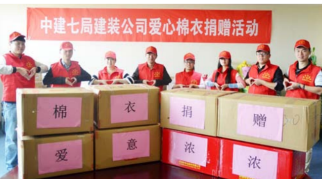
七局建装捐赠爱心棉衣

近日,中建七局华北公司郑州瑞春项目现场附近的村民生活区意外起火,大火迅速蔓延至周边房屋。距离火灾现场一墙之隔的项目管理人员迅速赶到现场,砸开工地围挡,利用项目洒水车配合消防队救火。经消防官兵、项目部和村民近40分钟的合力扑救,大火终于被扑灭。