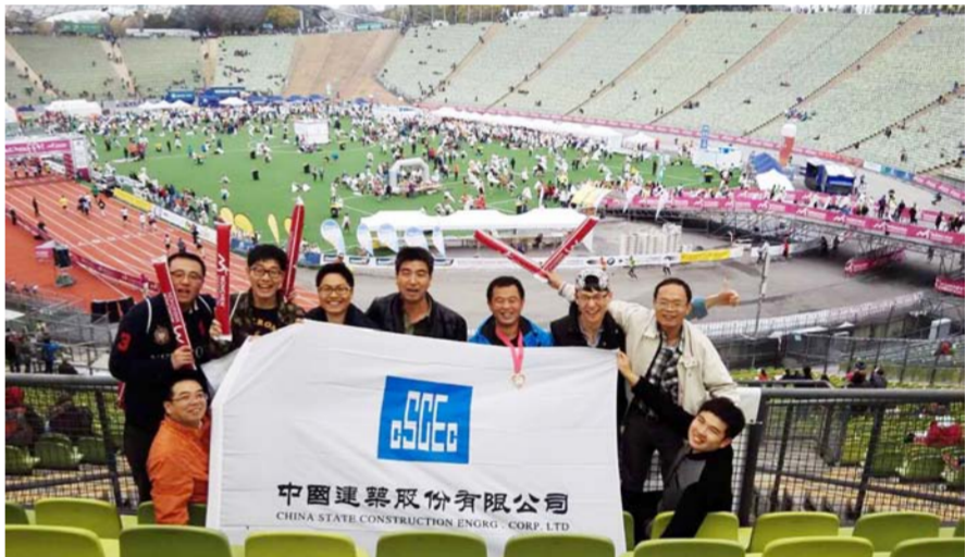
中建员工参加慕尼黑国际马拉松比赛

近日,中建二局一公司第二届“超越”杯篮球赛在北京举行,12支队伍约120名员工参加了比赛。此次球赛全程通过手机APP进行了现场直播。该公司上海分公司险胜深圳分公司获得冠军。