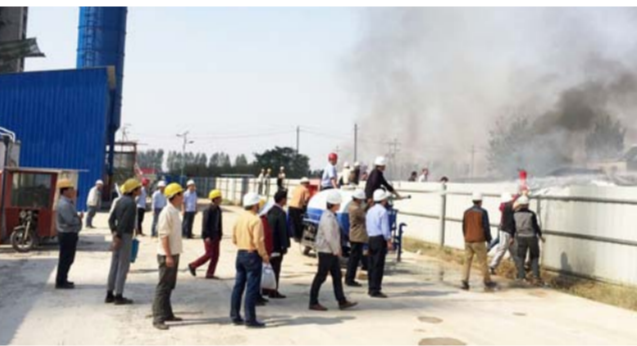
七局瑞春项目部速救起火村民生活区

近日,中建七局华北公司郑州瑞春项目现场附近的村民生活区意外起火,大火迅速蔓延至周边房屋。距离火灾现场一墙之隔的项目管理人员迅速赶到现场,砸开工地围挡,利用项目洒水车配合消防队救火。经消防官兵、项目部和村民近40分钟的合力扑救,大火终于被扑灭。