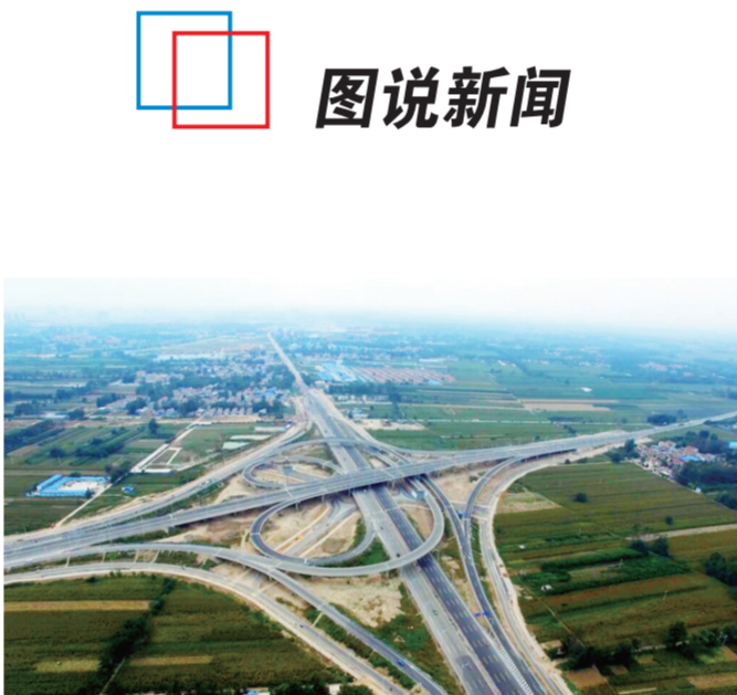
近日,由中建七局交通公司负责施工,主线全长4.77千米、有“豫东第一桥”之称的商丘首座互通式立交工程一次性通过竣工验收。(王海伟 寇长城)