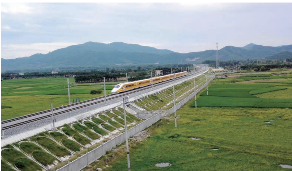
经过700多个日夜的不懈努力,近日,中建六局铁路公司海南西环铁路项目施工段开始联调联试,四季常绿、世界首条环岛高速铁路即将开通运营。(孙健)