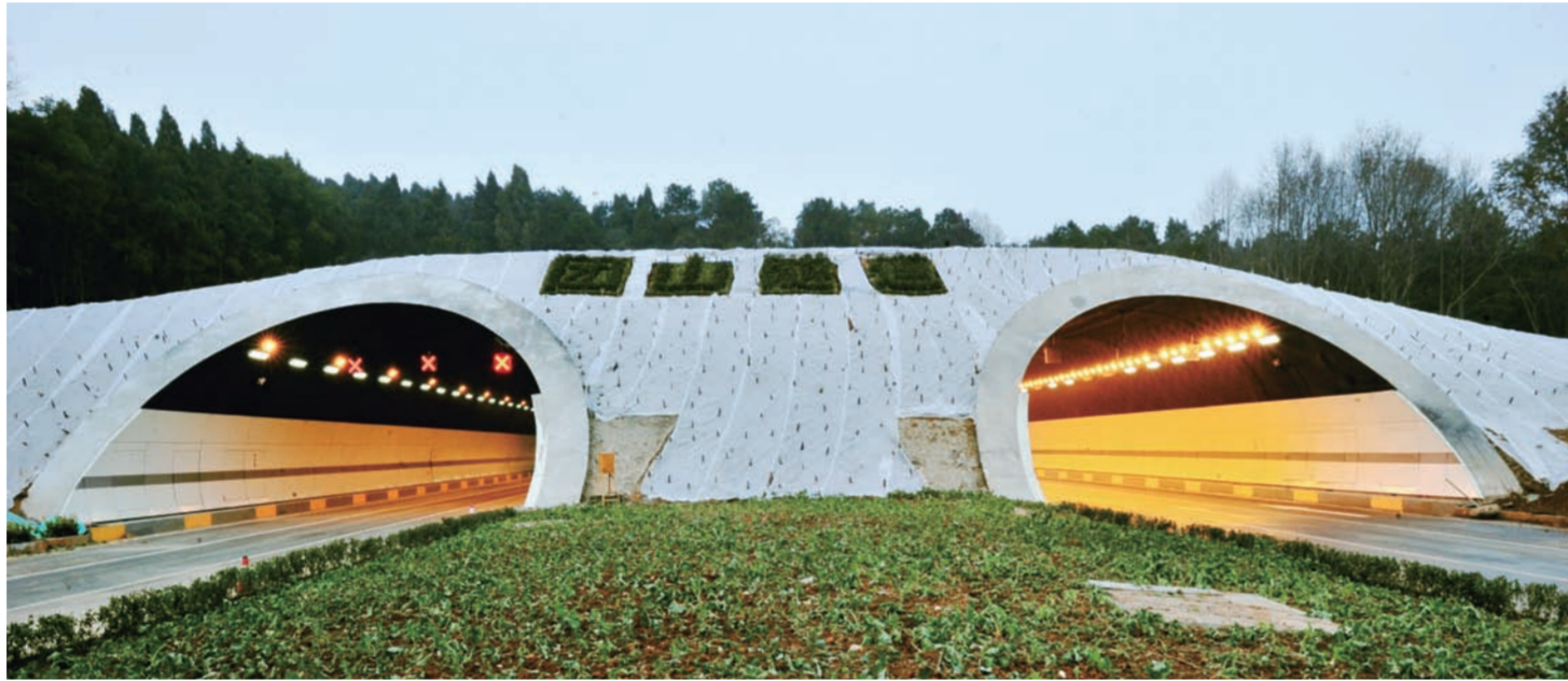
近日,中建三局投资建设的国内最长城市海底隧道——全长10.6公里的武汉东湖隧道正式通车。图为该隧道团山出入口。(吴文昭 王璇)