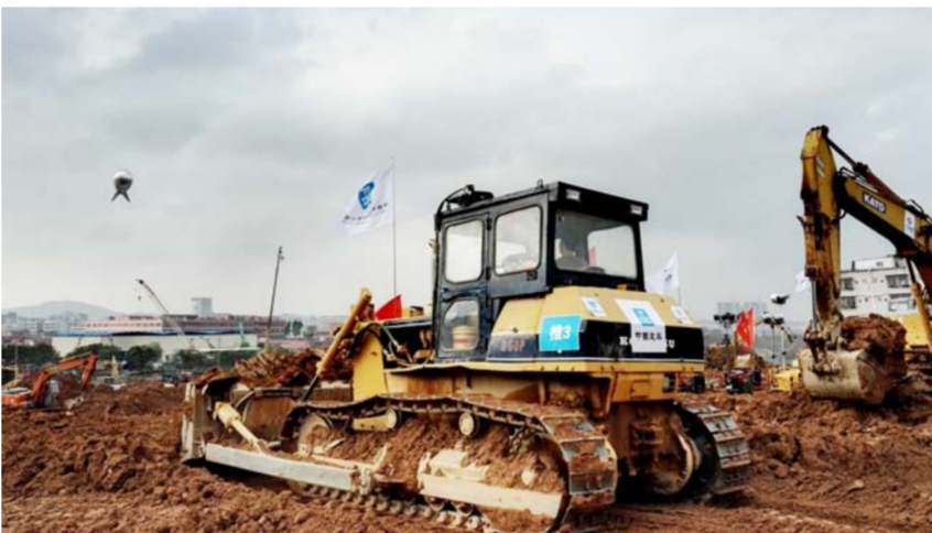
现场机械正在进行土方清理工作。