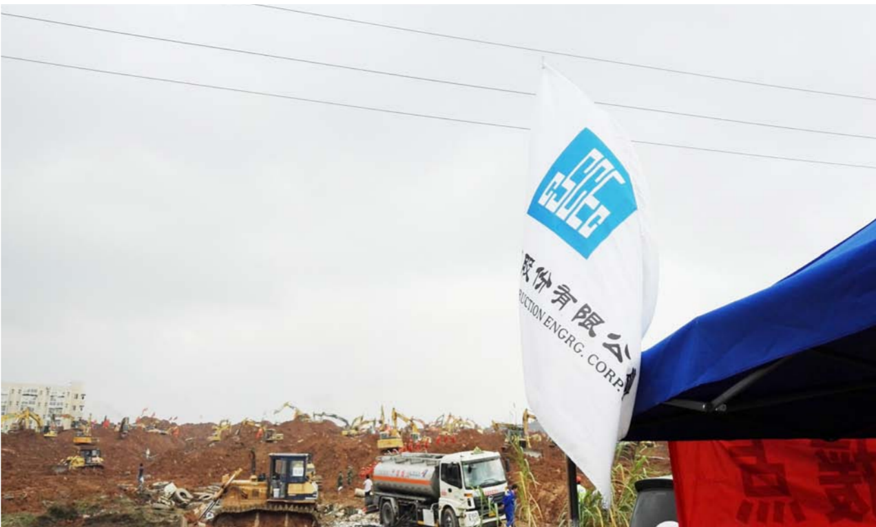
中国建筑全力参与深圳渣土滑坡救援抢险工作。