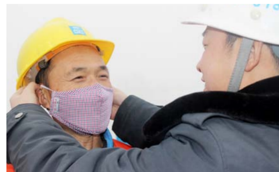
中建六局天津地铁6号线金钟河大街站项目部为工友发放防霾口罩

日前，中建四局三公司为80多个在建项目的一线工友送去10万余个饺子、羊肉1000余斤，让工友们感受到了冬日温暖。图为遵义市奥体中心项目工友们高兴地吃饺子。(李安心)