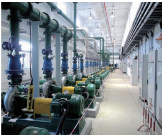
近日,中国建筑首个核电站建安一体化厂房——中建电力田湾核电项目除盐水厂房输送盐水的系列泵组完成安全调试,提前完成节点目标,业主特意发来感谢信。(关明杰 王永耐)