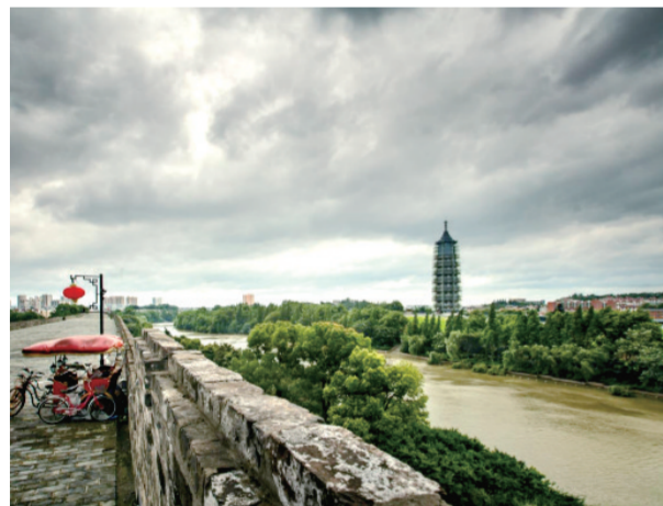
近日,位于秦淮河畔、曾出土“佛顶真骨”等大批国家级文物和圣物的南京大报恩寺遗址公园项目经过中建八局青岛公司近三年的艰苦建设,盛大开园。图为从中华门远眺大报恩寺塔。(韩海涛)