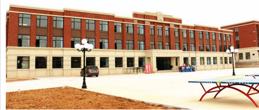
中海集团捐资500万元建立的中国海外亭口希望小学正式交付

近日，中国海外亭口希望小学在烟台栖霞市亭口镇交付。据悉，该小学前身是栖霞“亭口小学”，校舍建于上个世纪60-90年代，属砖混结构，经鉴定无法达到抗震设防要求。中海集团捐资500万元对校舍进行整修、重建。新建小学占地面积21770平方米，总建筑面积7861平方米，现有班级11个、学生387人，配有学前班和食宿楼，并设有计算机室、美术室、音乐室等各类功能室。