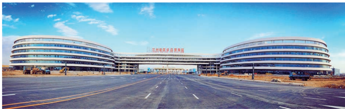
近日,中建一局二公司负责履约、建筑面积达10万平方米的兰州新区综合保税区综合楼项目正式封关运营并完成首单货物通关,为促进丝绸之路经济带沿线国家的经贸合作创造了新的条件。该保税区位于汉新欧、郑新欧、渝新欧、义新欧等中欧班列黄金通道,于2015年8月18日通过国家部委验收。(王永茜 孙浩然)