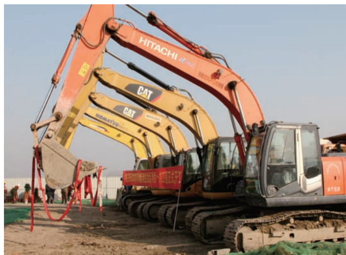
近日,中建三局总承包天津分公司天津静海健康产业园体育基地新建生活区项目正式破土动工。该工程总建筑面积6.38万平方米,由3栋十七层单体宿舍和2栋三层餐厅组成,预计于2016年7月底实现主体结构封顶。(苏鲲)

信心,真抓实干,下大力气狠抓市场,抓大项目,抓好项目,全力以赴稳增长;二是精准发力,在立足做精做优传统主业的基础上,着力地下空间、基础设施和工程总包EPC业务,转型攻坚开新局;三是多措并举,以提升营销模式、提高项目品质、强化管控水平、加大创新创优、加快“两化融合”为抓手,持续用力促升级;四是固本培元,强化组织和人才队伍建设,持之以恒强保障;五是围绕中心,借力重大活动和学会协会平台,坚持不懈塑品牌。