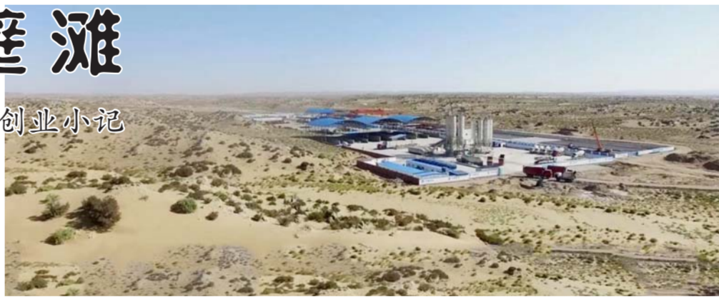
京新项目三分部驻地