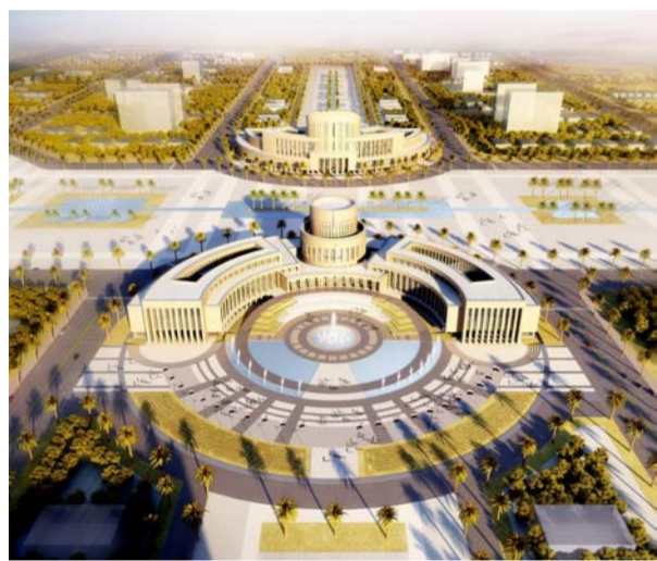
埃及议会大厦效果图

1月21日下午,在中埃两国元首的见证下,中国建筑签署了埃及新首都建设一揽子总承包合同,总金额27亿美元。消息传来,两国舆论振奋,而参与项目设计的中建西南院团队更是激动不已。