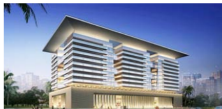
埃及住建部大楼效果图