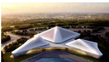
埃及国家会议中心效果图

辛勤的汗水化作丰硕的成果,艰苦的奋战化作成功的喜悦。梦想达成,向着埃及,中建西南院从四川盆地迈向国际化的步伐稳健而自信,坚定且成功。