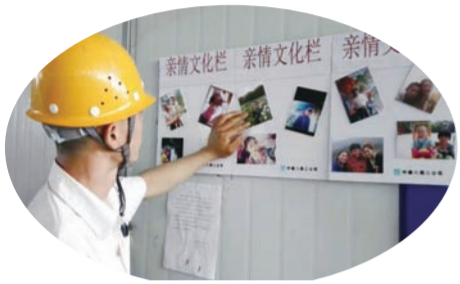
中建八局二公司装饰分公司青岛国际创新园项目制作“亲情文化墙”。