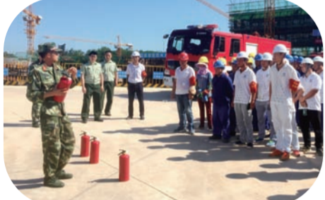
中建六局华南分公司开展防汛、灭火等实战演练，请消防官兵讲解灭火要点。

红线不可逾越，生命不会重来。在第十五届“安全生产月”之际，中建系统各单位围绕“强化安全发展观念，提升全民安全素质”这一主题，创新形式，深化内容，共建“平安中建”“平安中国”。