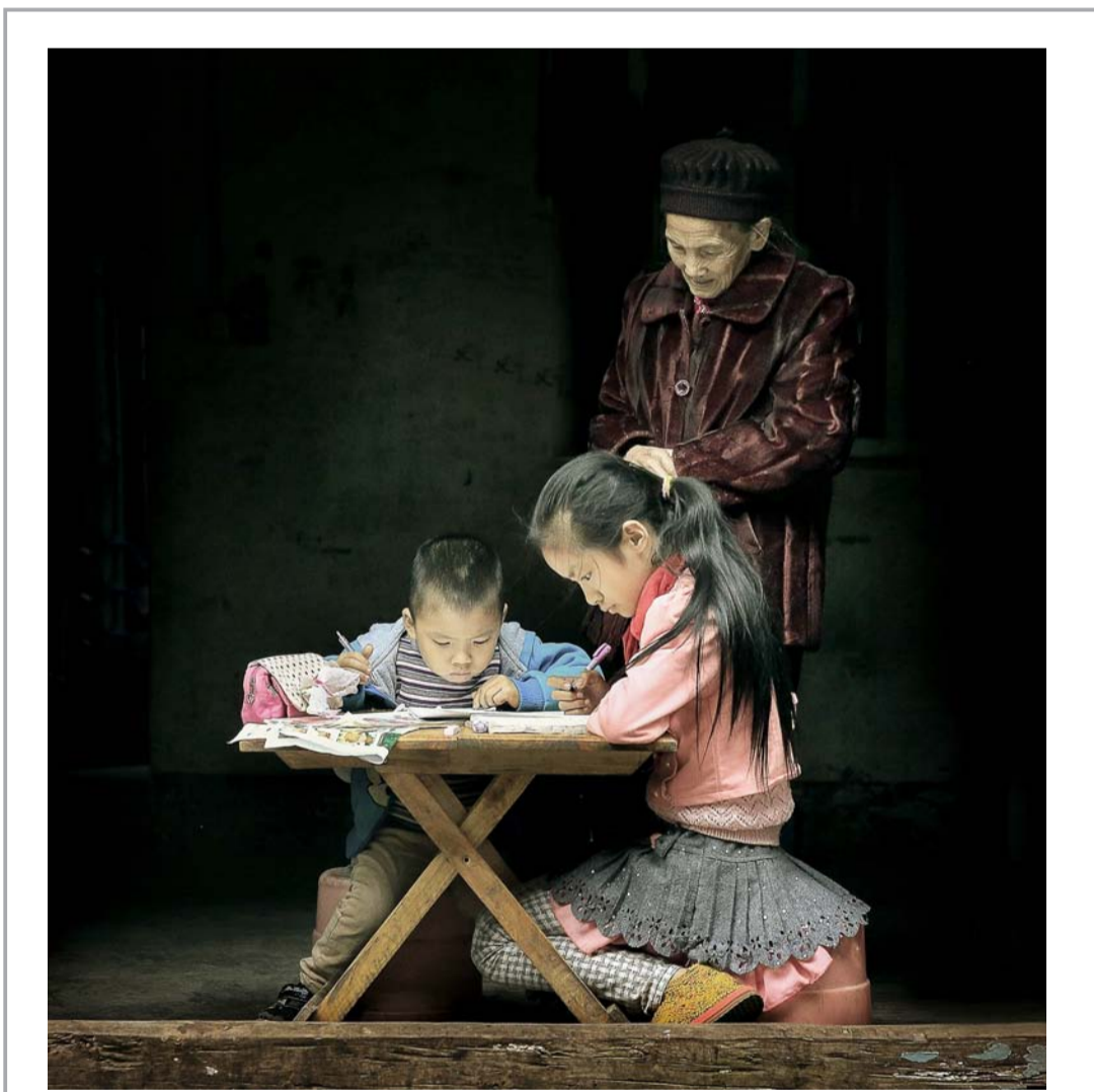
摄影 追梦 张继均/摄