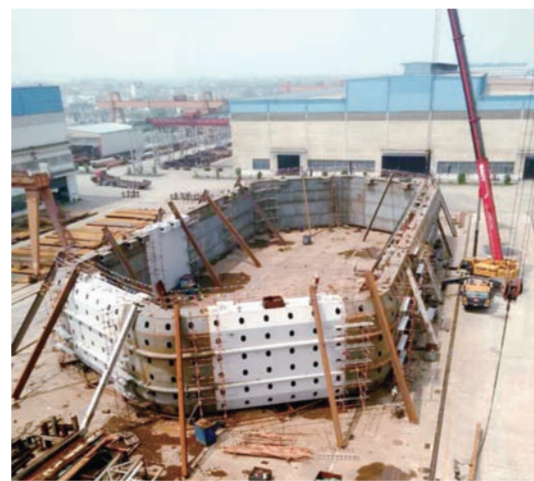
近日，由中建钢构华东大区江苏厂制造的温州鳌江六桥主墩钢套箱预拼装成功。此钢套箱重620吨，长67.3米，宽30.8米，高8.3米，为国内最大的外挂式固定连接防撞设施，可通过本身变形吸收消耗船舶撞击的动能，保护桥墩。（沈念龙）

近日，中建五局与株洲市政府合作的BT项目——株洲神农大剧院项目通过竣工验收。该项目由一个1400座剧院、一个400座实验剧场等组成，先后获得国家工法和全国钢结构金奖。（何小龙）