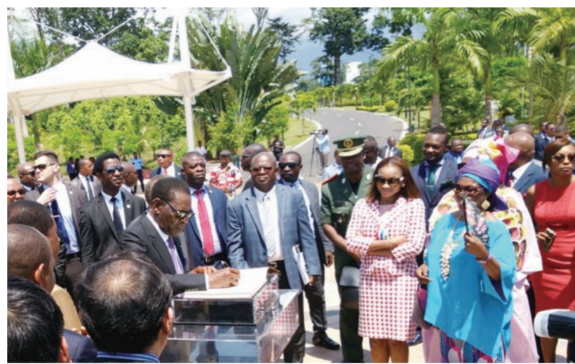
近日，中建装饰集团中外园林承建、占地87万平方米的赤道几内亚马拉博国家公园举行开园仪式，赤总统奥比昂出席、讲话并题词。该公园是自1970年中赤建交46年以来，两国之间最大、最重要的合作项目之一。（李虹钢）

虚拟现实（Virtual Reality，简称VR），是一种可以创建和体验虚拟世界的计算机仿真技术，目前在建筑行业应用甚少。