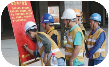
东方装饰公司达州中心医院项目组织员工开展安全生产承诺并签名。