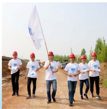
4月21日,中国建筑官方微信正式开通,海内外中建人和社会各界人士踊跃扫码,并举办各种活动,关注中国建筑官方微信公众号。